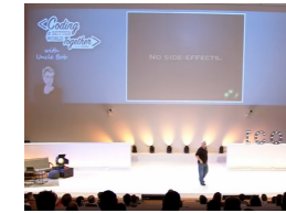
Clean Code - Uncle Bob / Lesson 1 https://youtu.be/7EmboKQH81M