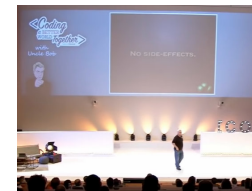
Clean Code - Uncle Bob / Lesson 1 https://youtu.be/7EmboKQH81M