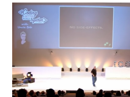
Clean Code - Uncle Bob / Lesson 1 https://youtu.be/7EmboKQH81M