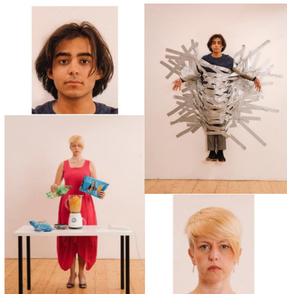
Max Siedentopf: Passport photos

Domníváte se, že udělat fotografie na pas je nuda? Rozhodně tomu tak není! Dokázal to svými pracemi moderní fotograf Max Siedentopf. Ukázal, že nikdy nemůžeme přesně vědět, co se děje v okamžiku zmáčknutí spouště.