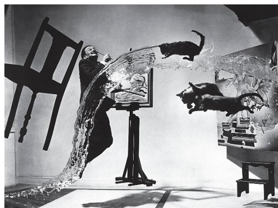
Philipp Halsman: Dali Atomicus

V roce 1948 Philipp Halsman potřeboval právě tolik času na to, aby vytvořil snímek "Dali Atomicus". Proces focení vypadal takto: stojan a obraz byly zavěšeny ze stropu na vlasci, levitující židli v popředí držela manželka fotografa a dva další asistenti do scény házeli kočky a stříkali vodu. A to opakovali 28krát!