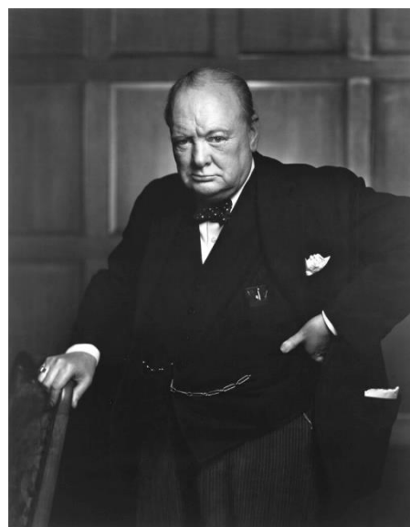
Yousuf Karash: Winston Churchill

Dne 30.12.1941 dostal Karash za úkol vyfotit britského premiéra Winstona Churchilla. V onen den byl politik zamračený, našťvaný a na fotoaparát se díval s nechutí. Ale bylo to přesně to, co ke své práci fotograf potřeboval. K dokonalosti snímku překážel jen doutník, který měl premiér v ústech. Proto k němu Karashi přistoupil, doutník mu z úst vytáhl a odhodil ho. V okamžiku, kdy si Churchill uvědomí, co fotograf udělal, zamračí se ještě více, nasupeně nakloní hlavu a našťvaně si položí ruku v bok. V tu chvíli Karashi stiskl spoušť. Tak byla vytvořena fotografie, která se stala jedním z nejslavnějších portrétů 20. století.