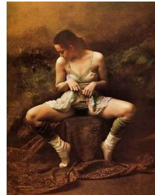
Obrázek 7: Stud – Jan Saudek (1985) [6]

-Noemi Smolíková, výtvarná teoretička [2]