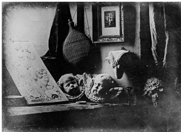
Obrázek 2: Daguerreotype – Daguerre Atelier (1837) [4]

Velmi velkou revolucí pro fotografii je zmíněná digitální éra. Dříve fotit nebylo tak přístupné jako teď. Proč se tomu tak děje? Pokrok je nezastavitelný. Dříve jsme museli nosit fotoaparát jako Leica, abychom si něco vyfotili. Bylo omezené množství fotografií, protože každý snímek se počítal. Ale co teď? Každý máme mobilní telefon a v tuto chvíli jsou dokonce i v těchto malých krabičkách velmi obstojné fotoaparáty. Ve chvíli, kdy si chceme něco vyfotit, tak ho vytáhneme z kapsy a „cvak“, je hotovo. Neztrácí to ovšem to kouzlo? Vždyť začátek fotografie byl zachycení nějakého okamžiku, ale teď je