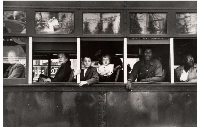
Obrázek 5: Trolley – New Orleans – Robert Frank (1955) [5]

Umělecká fotografie se vymyká pouhému zachycení reality. Stává se mocným nástrojem pro sdělování myšlenek, evokaci emocí a sdílení jedinečného vnímání světa umělce. Na rozdíl od dokumentární fotografie, která se zaměřuje na objektivní záznam, umělecká fotografie klade důraz na kreativní interpretaci a estetické vyjádření. Umělecká fotografie není jen o technické dokonalosti, ale také o hlubokém pochopení světa a lidské zkušenosti. Fotograf s citlivým vnímáním dokáže zachytit pomíjivé momenty krásy, skryté emoce a podstatu lidské existence. Jeho fotografie tak slouží jako okno do duše umělce i do světa, který ho obklopuje. Mezi průkopníky umělecké fotografie na našem území můžeme považovat Jana Saudka (Obrázek 7) a dalšími jsou například Henri Cartier Bresson (Obrázek 6).