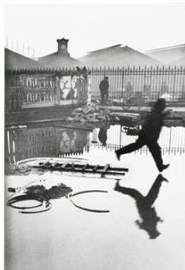
Obrázek 6: Behind the Gare St. Lazare – Henri Cartier Bresson (1932) [7]

Umělecká fotografie se vymyká pouhému zachycení reality. Stává se mocným nástrojem pro sdělování myšlenek, evokaci emocí a sdílení jedinečného vnímání světa umělce. Na rozdíl od dokumentární fotografie, která se zaměřuje na objektivní záznam, umělecká fotografie klade důraz na kreativní interpretaci a estetické vyjádření. Umělecká fotografie není jen o technické dokonalosti, ale také o hlubokém pochopení světa a lidské zkušenosti. Fotograf s citlivým vnímáním dokáže zachytit pomíjivé momenty krásy, skryté emoce a podstatu lidské existence. Jeho fotografie tak slouží jako okno do duše umělce i do světa, který ho obklopuje. Mezi průkopníky umělecké fotografie na našem území můžeme považovat Jana Saudka (Obrázek 7) a dalšími jsou například Henri Cartier Bresson (Obrázek 6).