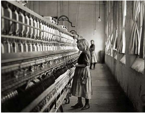
Obrázek 4: Child in Carolina Cotton Mill – Lewis Heine (1908) [9]