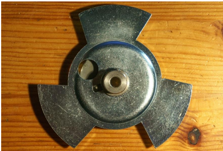
Obr. 1 Původní závěrka v promítačce Meopta Meos Duo.