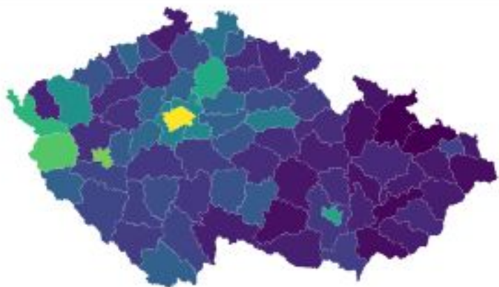
Přítomnost cizinců v ČR (přepočteno na osobu)

Jak přítomnost cizinců ovlivňuje míru kriminality na úrovni okresů v České republice?