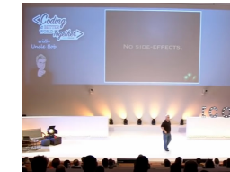
Clean Code - Uncle Bob / Lesson 1 https://youtu.be/7EmboKQH81M