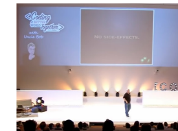
Clean Code - Uncle Bob / Lesson 1 https://youtu.be/7EmboKQH81M