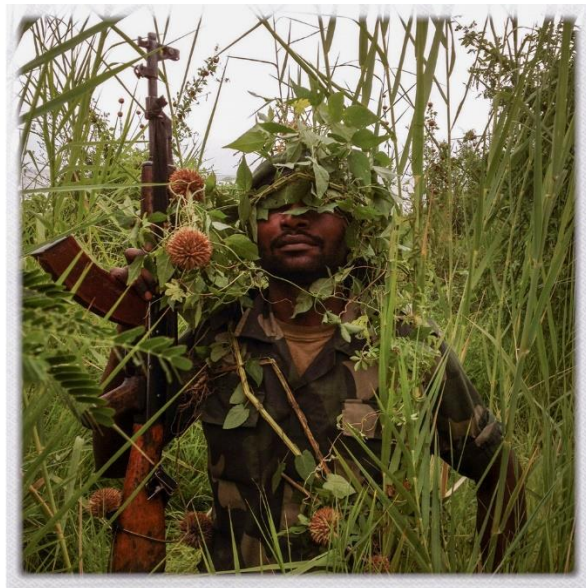
“An FARDC soldier poses for a portrait by Lake Kivu”.