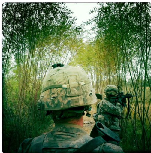
“While on patrol to clear its way out of Nahr-i-Sufi, the 2nd Platoon came under fire”.