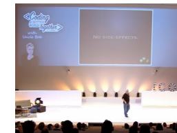
Clean Code - Uncle Bob / Lesson 1 https://youtu.be/7EmboKQH81M