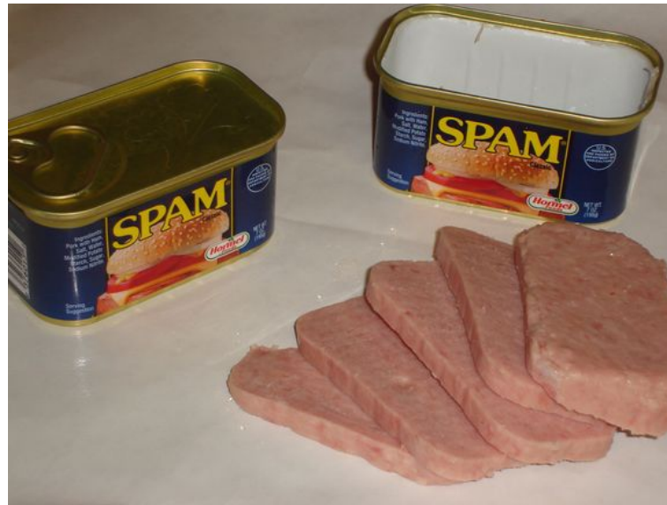
Hormel Foods Corporation, 1937