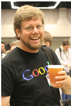
Obrázek: Guido van Rossum