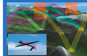
Komplexní operace bezpilotních letounů http://agents.felk.cvut.cz/