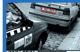
Detekce a rozpoznání registračních značek http://cmp.felk.cvut.cz/