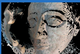
Rekonstrukce 3D modelu z fotografií http://cmp.felk.cvut.cz/