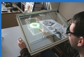
Rozšířená realita http://dcgi.felk.cvut.cz/