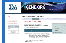
Nástroj pro analýzu dat genové exprese http://ida.felk.cvut.cz/