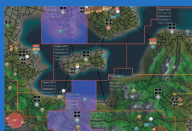
Agentní simulace asymetrické hry http://agents.felk.cvut.cz/